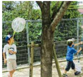
保育園の園庭で 元氣いっぱいセミ取り競争♪