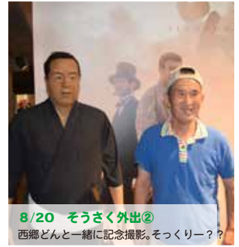
8/20 そうさく外出② 西郷さんと一緒に記念撮影。そっくりー？