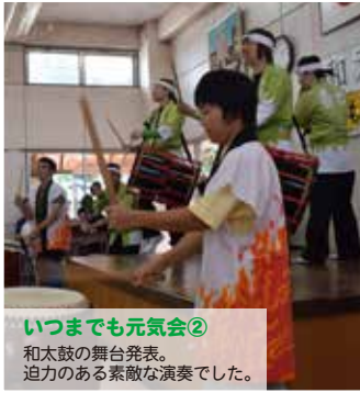
いつまでも元気会② 和太鼓の舞台発表。迫力のある素敵な演奏でした。