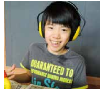
7/23 タイル鍋敷き工作 色どりを考えながら、可愛く出来ました♪