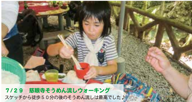
7/29 慈眼寺そうめん流しウォーキング スケッチから徒歩50分後のそうめん流しは最高でした♪