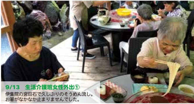
9/13 生活介護班女性外出① 伊集院の宮田石で久しぶりのそうめん流し。お箸がなかなか止まりませんでした。