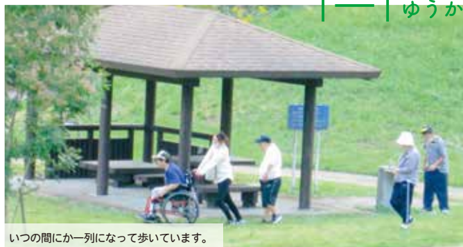
いつの間にか一列になって歩いています。