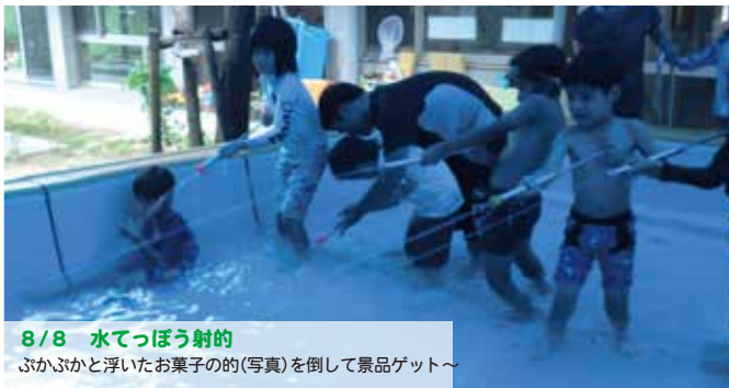
8/8 水てっぽう射的 ぶかぶかと浮いたお菓子的(写真)を倒して景品ゲット～