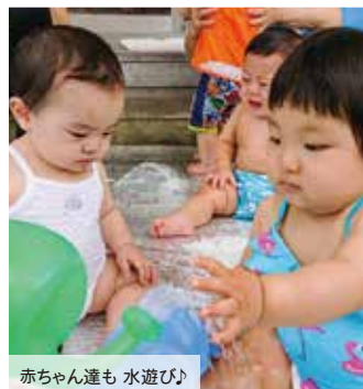
赤ちゃん達も 水遊び♪