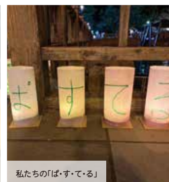
私たちの「ぱ・す・て・る」