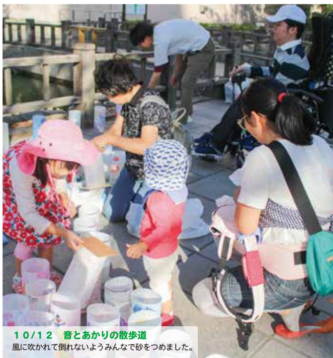
10/12 音とあかりの散歩道 風に吹かれて倒れないようみんなで砂をつめました。