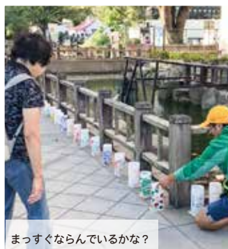
まっすぐならんでいるかな？