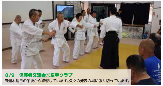
8/9 保護者交流会①空手クラブ 毎週木曜日の午後から練習しています。久々の発表の場に張り切っています。