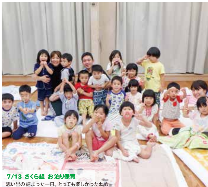
7/13 さくら組 お泊り保育 思い出の詰まった一日。とっても楽しかったね☆