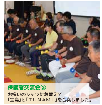
保護者交流会③ お揃いのシャツに着替えて「宝島」と「TUNAMI」を合奏しました。