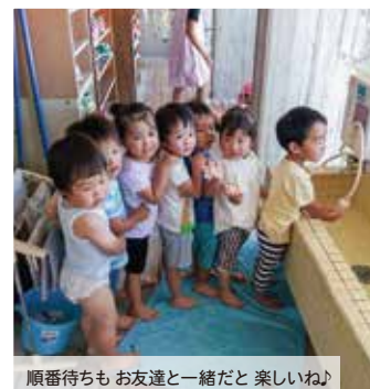
順番待ちも お友達と一緒にだと 楽しいね♪