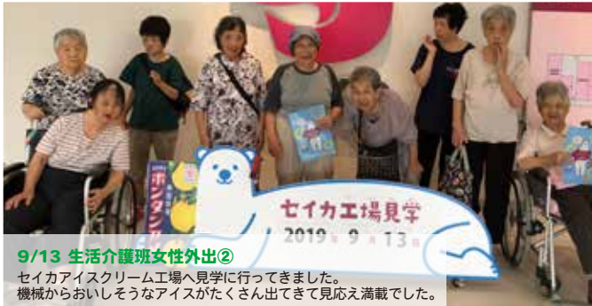
9/13 生活介護班女性外出② セイカアイスクリーム工場へ見学に行ってきました。機械からおいしいそうなアイスがたくさん出てきて見応え満載でした。