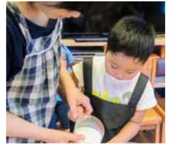
8/7 かんたんクッキング みんなで工程を分担して杏仁豆腐を作りました。