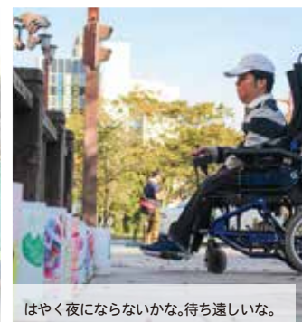
はやく夜にならないかな。待ち遠しいな。