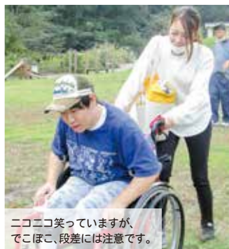
ニコニコ笑っていますが、 でこぼこ、段差には注意です。