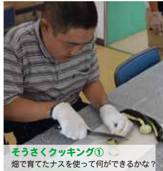
そうさくクッキング① 畑で育てたナスを使って何ができるかな？