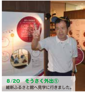
8/20 そうさく外出① 維新ふるさと館へ見学に行きました。