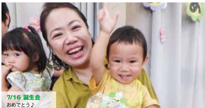
7/16 誕生会 おめでとう♪