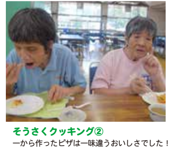
そうさくクッキング② 一から作ったピザは一味違うおいしさでした！