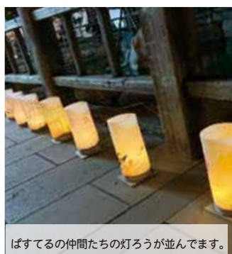
ぱすてるの仲間たちの灯ろうが並んでいます。