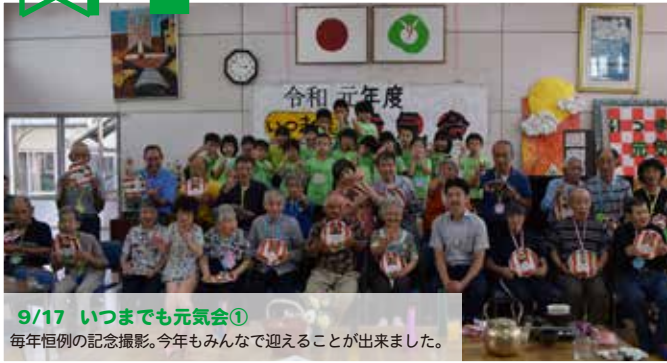
9/17 いつまでも元気会① 毎年恒例の記念撮影。今年もみんなで迎えることが出来ました。