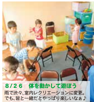
8/26 体を動かして遊ぼう 雨で渋々、室内レクリエーションに変更。 でも、皆と一緒にやっぱ楽しいなあ♪