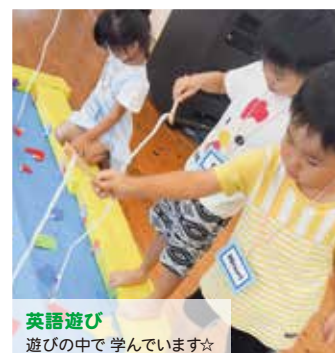
英語遊び 遊びの中で 学んでいます☆