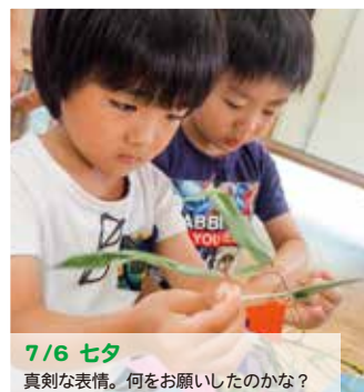
7/6 セタ 真剣な表情。何を願ったのかな?