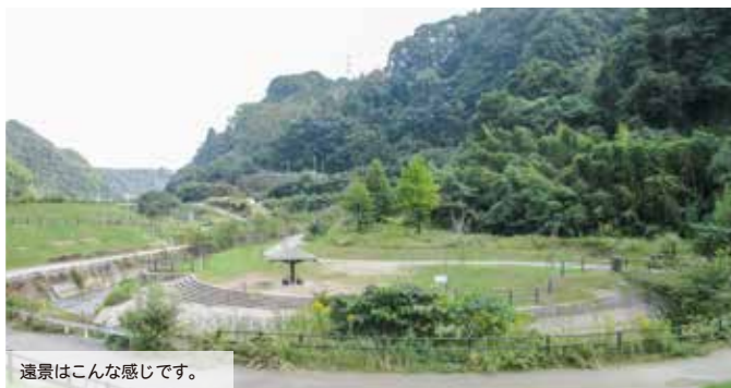
遠景はこんな感じです。