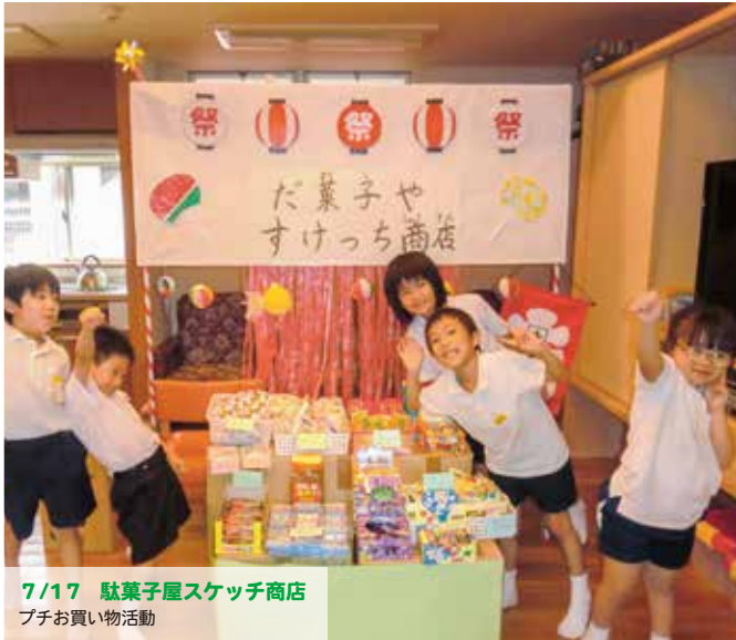
7/17 駄菓子屋スケッチ商店 プチお買い物活動