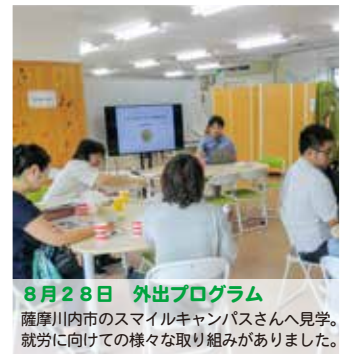
8月28日 外出プログラム 薩摩川内市のスマイルキャンパスさんへ見学。 就労に向けての様々な取り組みがありました。