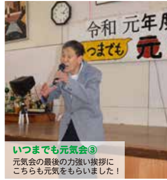
いつまでも元気会③ 元気会の最後の力強い挨拶にこちらも元気をもらいました！