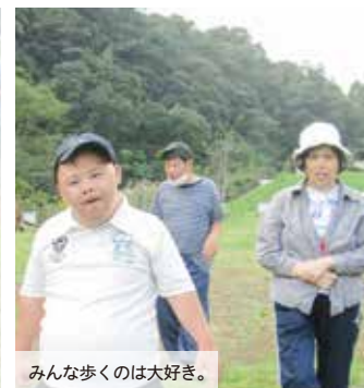
みんな歩くのは大好き。