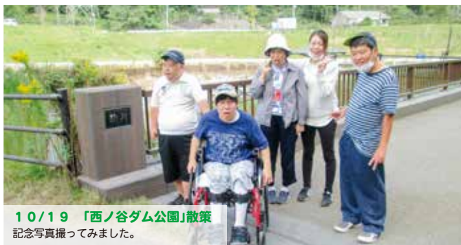
10/19 「西ノ谷ダム公園」散策 記念写真撮ってみました。