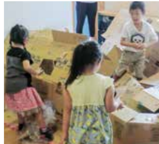
ダンボール基地の解体 いつもなら壊せないけど・・・ここぞとばかりに!