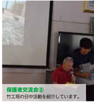
保護者交流会② 竹工班の年中活動を紹介しています。