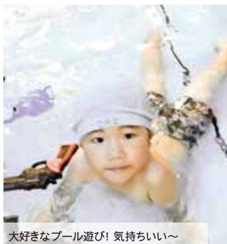
大好きなプール遊び! 気持ちいい～