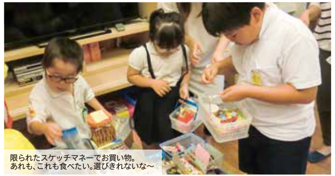
限られたスケッチマネーでお買い物。 あれも、これも食べたい。選びきれないな～