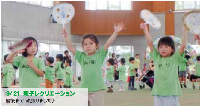
9/21 親子レクリエーション 最後まで 頑張りました♪